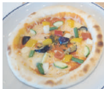
ミラノ風ピザ ¥ 540 (税込)