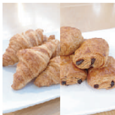
ミニクロワッサン ¥ 53 (税込) パン・オ・ショコラ ¥ 53 (税込)