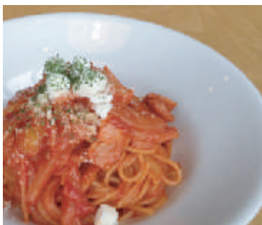
旬菜とナポリタン ¥ 880 (税込)