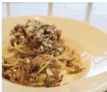
桜美豚のミートソース ¥ 920 (税込)