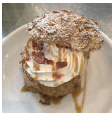
シュークリーム ¥ 216 (税込)